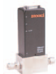
Hmotnostní průtokoměr 5860S