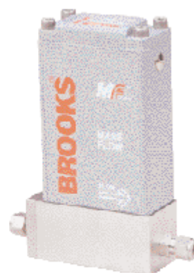
Hmotnostní průtokoměr Mf60i