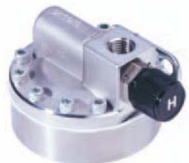
Regulátor průtoku 8800