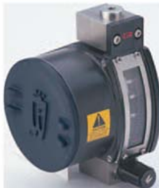
Průtokoměr 3750 AR-Mite s vysílačem / bez vysílače