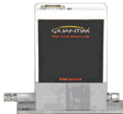
Model QMBC IP40

Po zadání příkazu „start“ je vstupní rychlost uhlovodíku regulována regulátorem QUANTIM. Vstupní rychlost drží na nastavené hodnotě pevně jako skála.